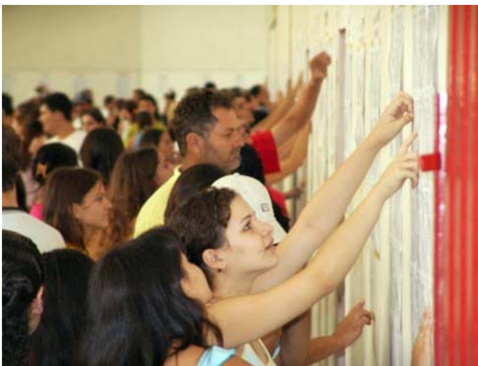
Divulgação do Resultado do Vestibular da UEM

O resultado do Concurso Vestibular de Inverno 2008 será válido apenas para o período a que se refere e seus efeitos cessarão, de pleno direito, com o prazo final de registro e matrícula.