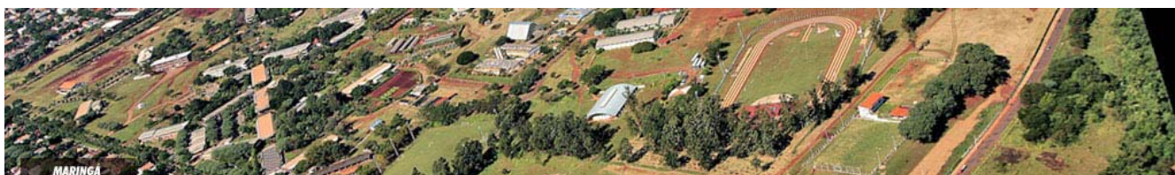
Vista aérea do campus da UEM - Maringá