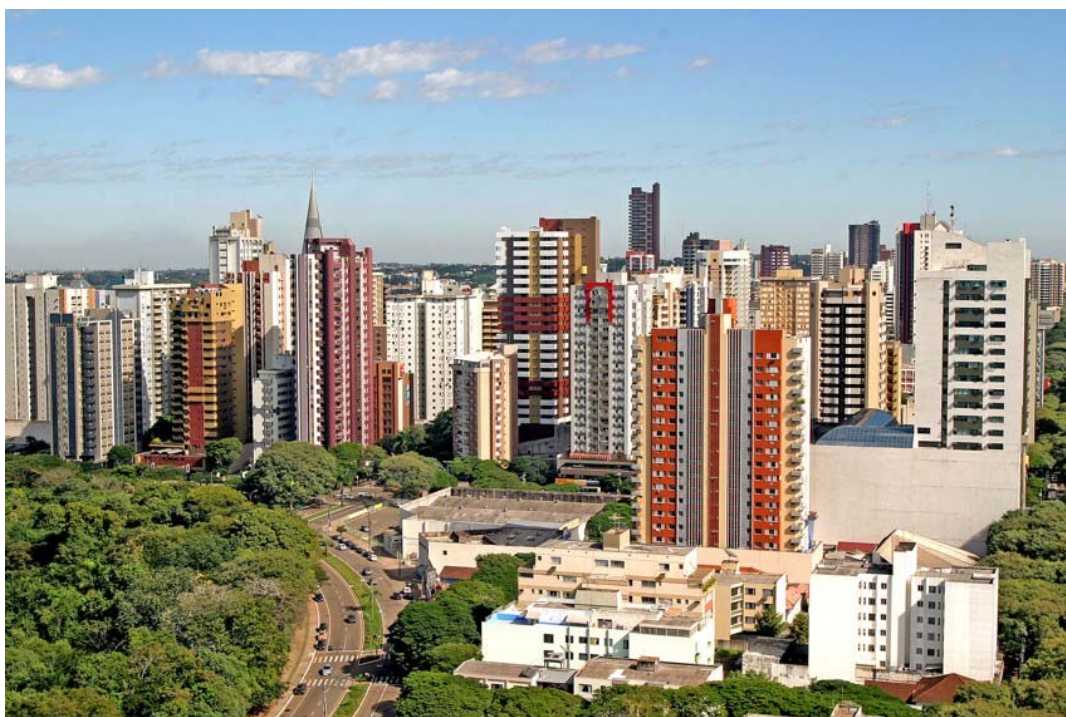
Região Central de Maringá